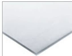
ポリエチレンフォーム