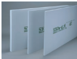
押出法ポリスチレンフォーム