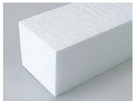
ビーズ法ポリスチレンフォーム