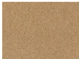
インシュレーションボード