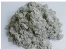
セルローズファイバー