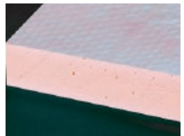
フェノールフォーム