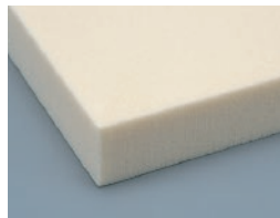
硬質ウレタンフォーム